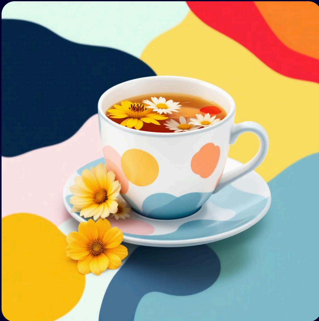
Chá de Camomila com Maracujá