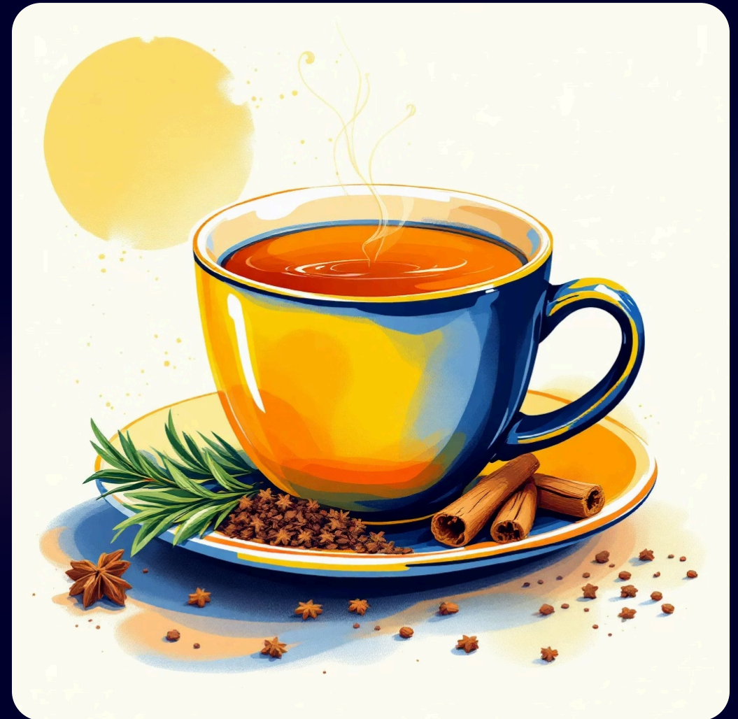
Chá de Alecrim com Canela e Cravo

Modo de preparo para ambos: Ferva a água, adicione os ingredientes, tampe e deixe em infusão por 10 minutos. Coe antes de consumir.